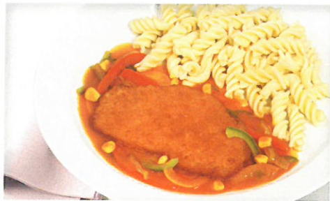
Paniertes Schweineschnitzel mit pikanter Schaschlik-Soße dazu Spiralnudeln