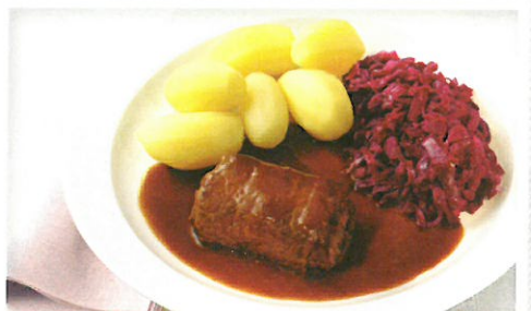
Rinderroulade „Hausfrauen Art“ in herzhafter Bratensoße mit Apfelrotkohl und Salzkartoffeln