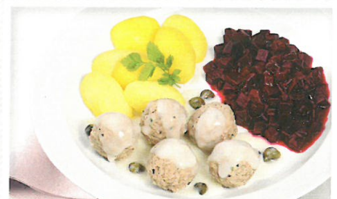
Klopse „Königsberger Art“ aus Rind- und Schweinefleisch dazu Rote-Bete-Gemüse und Salzkartoffeln