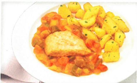
Zarte Hähnchenbrust auf buntem Paprikagemüse und würzigen Kräuterkartoffeln