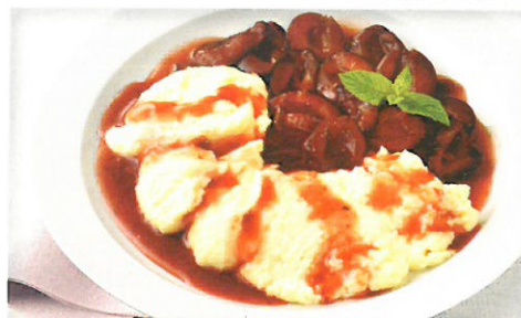
Hausgemachter Vollmilch-Grießbrei mit Pflaumenkompott (mit Süßungsmitteln und einer Zuckerart)