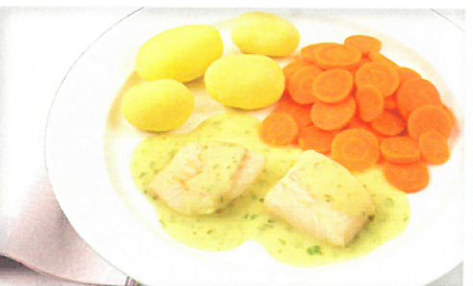
Filetstücke vom Schellfisch in Senf-Kräutersoße dazu Möhren und Salzkartoffeln